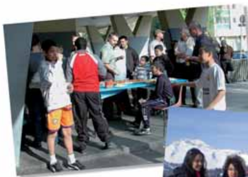
Après quelques péripéties, les habitants du 6, rue Denis-Papin ont fêté, la fin de la remise en peinture de leur montée. Étaient présents des représentants de la SDH, de la Ville, et des salariés de la Régie de quartier, Pro'pulse.