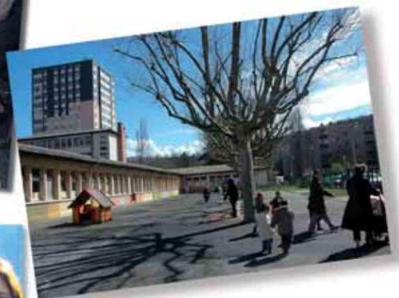
Enfants et parents sont de retour sur la placette commerciale avec l'arrivée de premiers rayons de soleil du printemps.

Prenez contact avec la Maison de la solidarité et des initiatives citoyennes (MSIC) : Tél : 04 76 23 46 90, place des commerces du Village 2