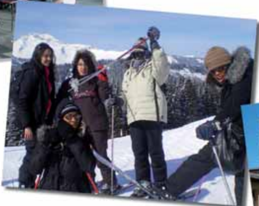
Du 14 au 21 février, 6 jeunes filles âgées de 14 à 16 ans ont participé au séjour organisé par le Pôle jeunesse Prévert à Morzine. Au programme, ski, chien de traîneau, détente et bonne humeur...