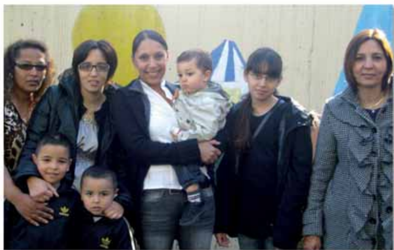
Deux mardis par mois, un groupe de femmes du Village 2 se réunit au Pôle jeunesse Prévert pour préparer avec l'aide des animateurs du Pôle, de la Msc et du centre social des Ecureuils, un séjour d'une semaine à la Grande-Motte cet été.