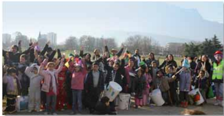
A l'occasion du carnaval, les enfants du centre de loisirs Prévert ont défilé à travers les rues du quartier dans la joie et la bonne humeur, destination le parc de la Frange Verte, où a été embrasé M.Carnaval

Entre un séjour à la montagne et la préparation d'un autre à la mer, les jeunes du centre de loisirs Prévert en ont profité pour fêter carnaval, et les habitants du 6 Denis-Papin, la réception des travaux de peinture de leur montée. Retour en images sur l'actualité !