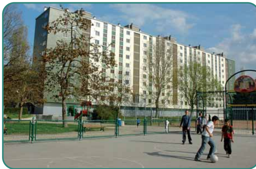
À l'image de la concertation menée avec les jeunes du quartier autour du futur terrain de sport, les ateliers sur les aménagements de l'espace urbain ont porté leurs fruits.

Les ateliers thématiques de janvier et février ont ainsi permis aux habitants de faire part de leurs remarques et de leurs attentes en matière d'aménagement de l'espace public. Des propositions, sou-