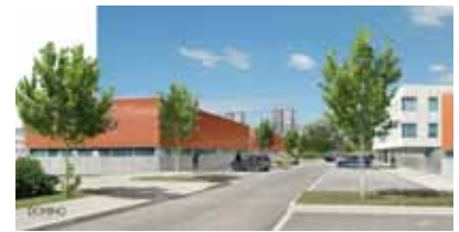
L'opération Artis 2 se compose de trois bâtiments et un total de 1650 m 2 de locaux.